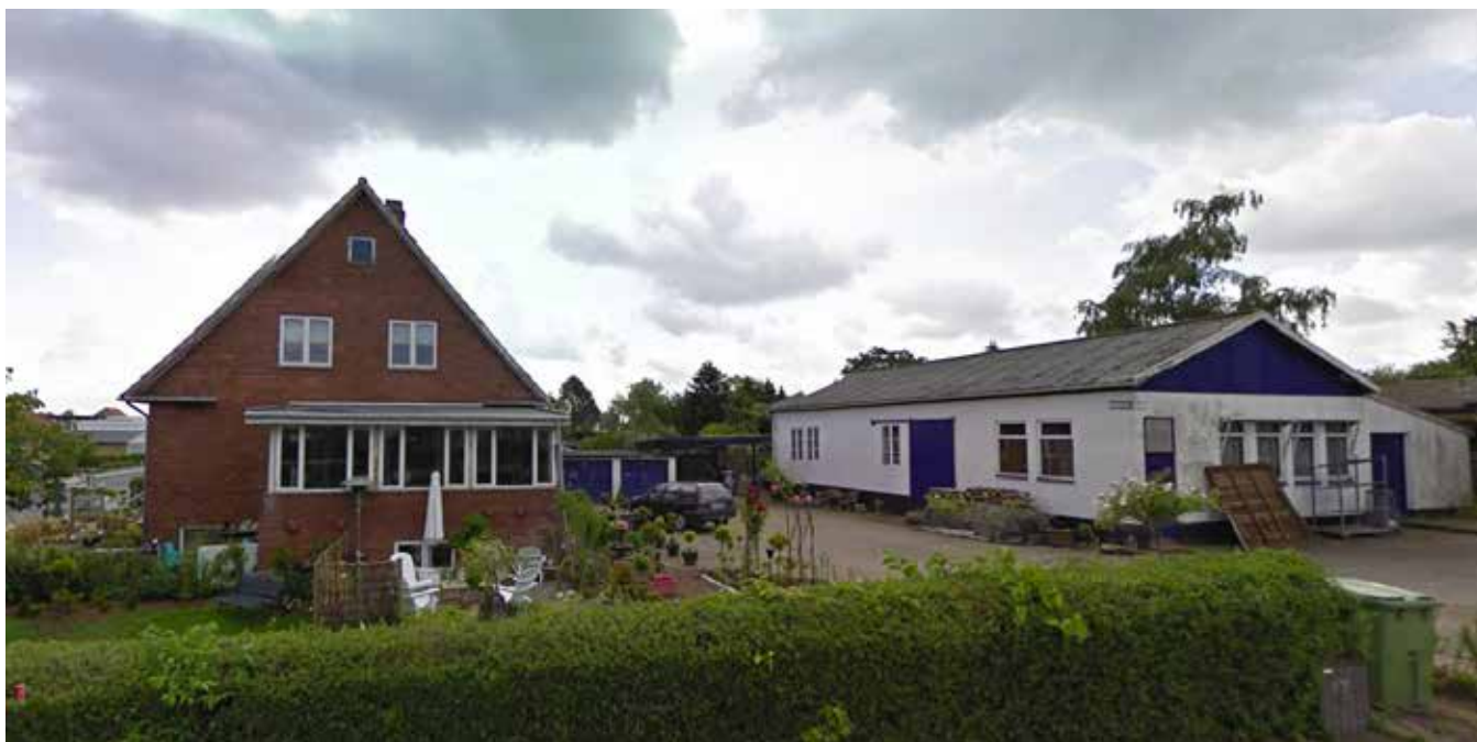
Slår man Konrad Jørgensens Vej op på Google maps, kommer dette billede frem. Sådan så ejendommen ud da Steen overtog den.

skal tage helt over. Men Steen har ingen planer om at smide sin murer-ske over skulderen og gå på pension lige med det samme. Han vil gerne være med lidt endnu, selvom alderen siger noget andet. ”Man kan jo godt mærke, at alderen kravler tættere på en,” siger Steen med et skævt smil. Men hey, der er også så meget andet, han gerne vil opleve.