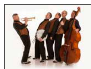
Creole Catz 26. oktober.