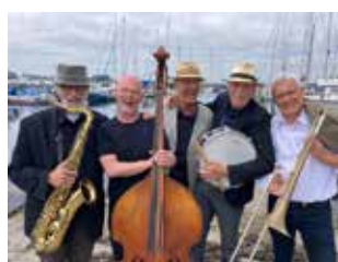
Finn Burich Jazz Band 25. maj.