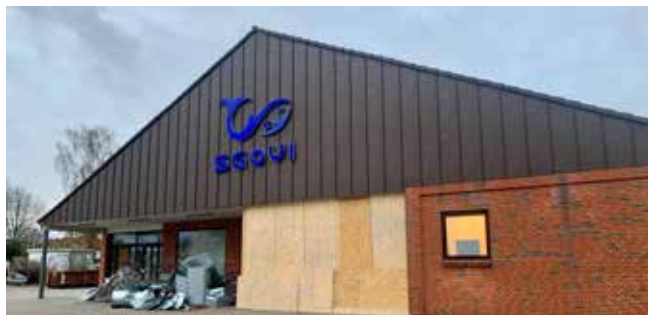
Tidligere Aldi-bygning forvandles til kæmpe madmarked og restaurant

Den store parkeringsplads rundt om den tidligere Aldi-butik er i øjeblik fyldt op med en masse håndværkerbiler og diverse byggematerialer. Der er også kommet store vinduespartier på siden af bygningen og restaurantens navn og logo er monteret på gavlen. Der er også meningen, at der med tiden kommer en del lade-standere til el-biler på pladsen.