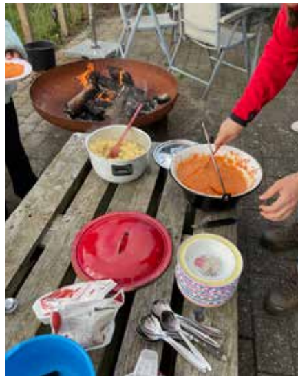
Tomatsuppe på bål i kolonihaven.

De frivillige i Gademix har været til velfortjent frivillig-fest og fået frivillig kage – STOR TAK til alle frivillige for deres store engagement og meget vigtige indsats gennem 2023.