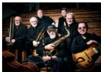
Bourbon Street Jazz Band 9. marts.