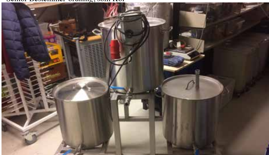
Vores udstyr til ølbrygning står i kælderen og skal slæbes op til køkkenet.

begynderproblemer, og nogle bryg var simpelthen udrikkelige og måtte kasseres. Dog fik vi efterhånden bed-