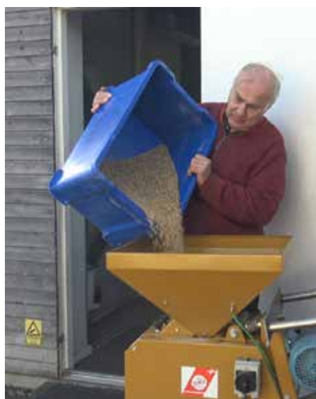
Malten kværnes udenfor. Det støver en del.

Bryggerne er i Kvarterhuset hver anden mandag, hvor vi enten brygger eller tapper i flasker. Selvfølgelig kan vi ikke undgå at skulle smage på det, vi nu har brygget sammen. Ja, så bliver det hele også meget sjovere.