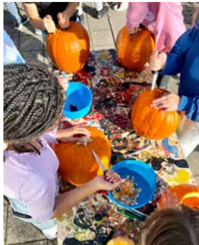
Der blev lavet flotte græskar-hoveder.