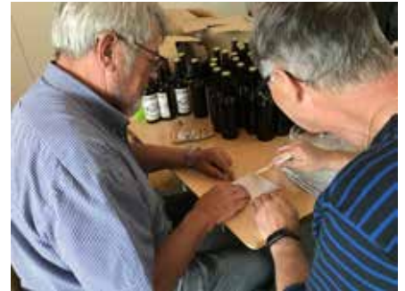
Etiketterne sættes på med kærnemælk

som vi købte sidste år. Der er en mand, der tapper og en anden, der sætter kapslerne på med en kapselpresse. Nogle andre går så i gang med at klistre etiketterne på, og det gør vi med kærnemælk. Det holder