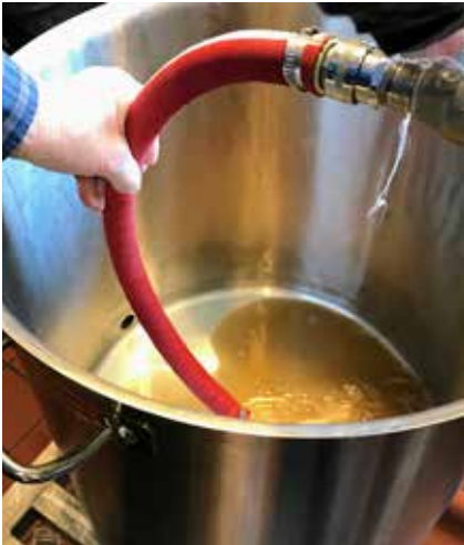
Her tappes vores ølurt i køgekar.

Vi kan så ikke altid blive enige om, om det nu smager godt eller mindre godt, så der skal prøvesmages nogle gange, før vi kan blive enige om, at vi ikke er enige.