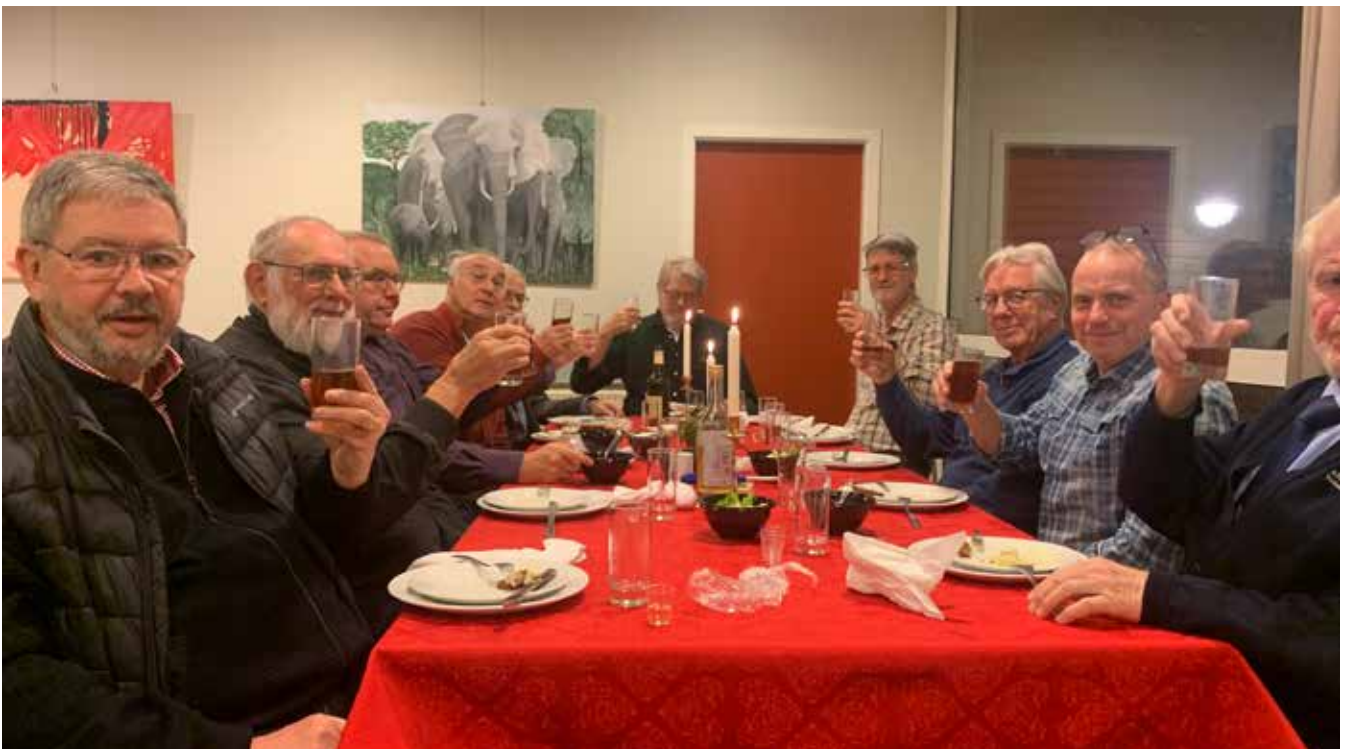
Så kan vi nyde vores eget bryg, her for eksempel ved vores årlige julefrokost

Ja, og så glæder vi bryggere os til at fordele øllet imellem os. Men vi får dem ikke foræret. Nej, nej, det