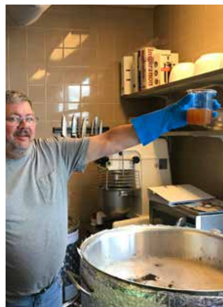
Humlen tilsættes urten.

Dengang vi startede, var vi ca. 20 bryggere. Vi er nu nede på 11 her sidst i 2023. Vi brygger cirka 7 gange om året, bortset fra årene 2020 og 2021, hvor Corona lukkede samfundet ned og dermed også Kvarterhuset. Hvert bryg er på ca. 40 liter, teoretisk set skulle det give 80 flasker, men der er altid lidt spild, så hvis vi når 70 flasker, er vi rigtig glade. I starten havde vi dog nogle