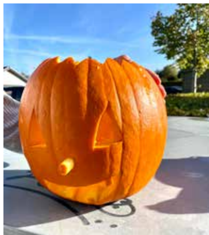
Her en af de flotte græskar-hoveder.