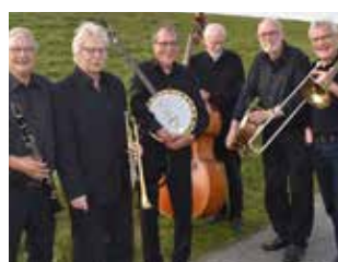
Vestre Jazzværk 14. september.