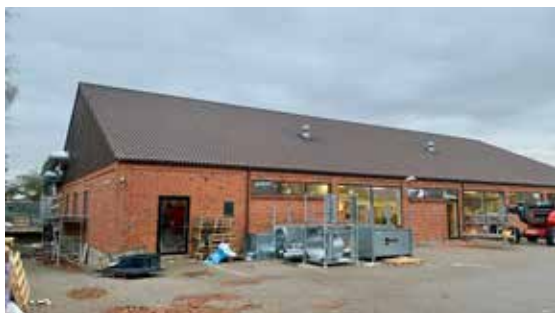
Her bygningen set fra Jovavej.

Den gamle ALDI -butik på Haderslevvej 100 bliver nu bygget om til en kæmpestor restaurant. I stedet for dagligvarer vil man fremover kunne handle færdiglaved mad. Det bliver sushi, dansk - og asiatisk mad. Der vil være buffet med grill, en masse forskellige fisk og desserter i et slags madmarked, der også er restaurant. Der vil være plads til 400 gæster og åbner i starten af 2024.