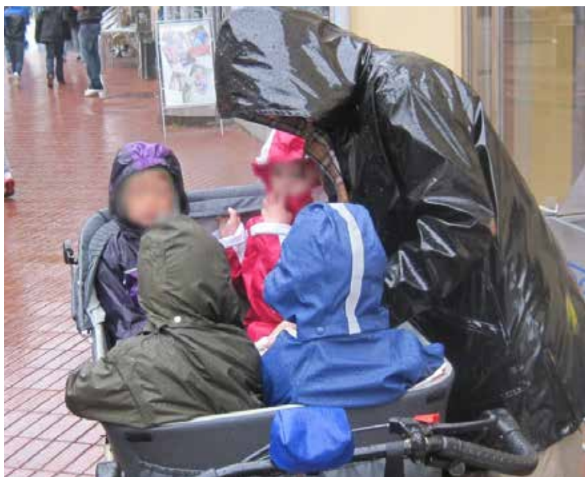
Med børnene i byen for at se HM Dronning i strilende regnvejr.

længer ind mod byen der hvor fortovet er højt op over vejen. De sagde bagefter at dronningen smilede og vinkede til dem. Nå pyt med, selvom vi blev gennemblødte, var det alligevel en imponerende oplevelse.