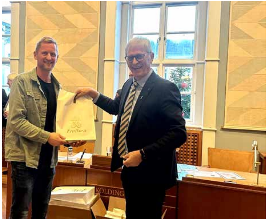
Borgmesteren overrækker donation til ny køkken fra Lions Kolding til Gademix

en haft morgenmadscafe hver tirsdag morgen, men morgenmadscafeen holder pause og det betyder nye åbningstider i Gademix.