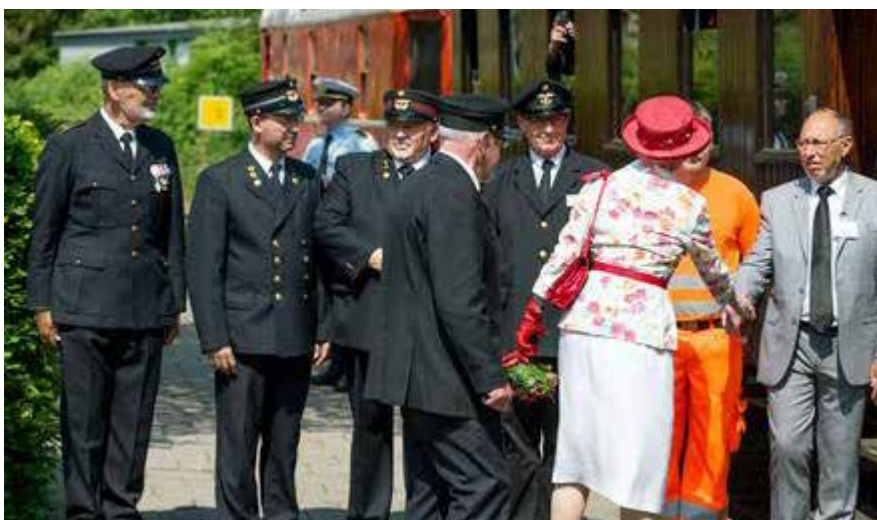
HM Dronningen ankommer til veterantoget og hilser på togpersonale.

Dronningen oplevede jeg igen smilende, imødekommende og venlig. Det var selvfølgelig kort, for i mellemtiden var der flere, som