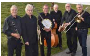
Vestre Jazzværk 14. september.