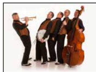
Creole Catz 26. oktober.