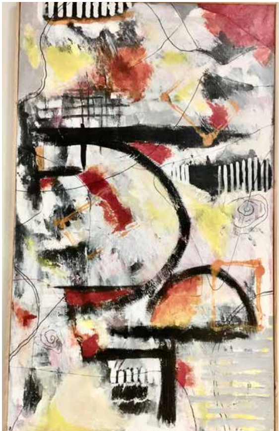
Nogle af de skønne malerier som nu er ophængt i mødelokalerne