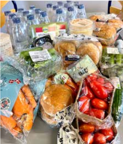
Onsdag aften laver vi madpakker sammen

Nu kan børn og unge fra Sydvest-kvarteret lave deres egne lækre madpakker i Gademix. Med støtte fra Trygfonden kan 10-16 årige HVER ONSDAG AFTEN smøre sig en madpakke og tage den med i skolen dagen efter. Tak til Cafe Netværket for et godt initiativ, så flere børn og unge kan få en god madpakke med i skole.