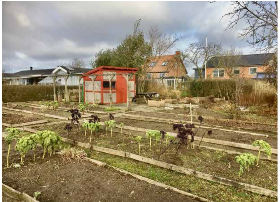
Kvarterhusets kolonihave i Mosvig Kolonihaveforening

Der er nu stillet spørgsmål om at få startet en læsekreds mere, fordi 8 personer i den bestående læsekreds er et passende antal pr. hold. Så er det noget for dig, så kontakt formanden.