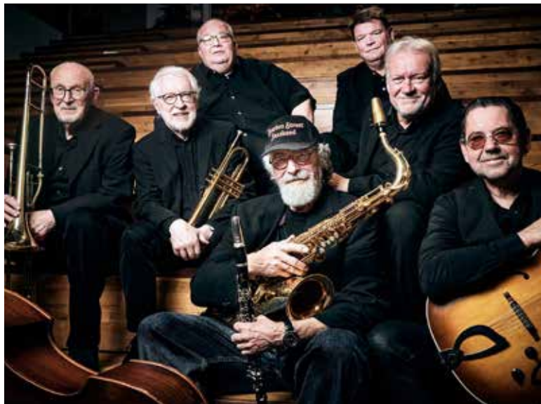
Bourbon Street Jazz Band:

Frokostjazz med Bourbon Street Jazz Band lørdag den 9. marts 2024 kl. 12.00 - kl. 15.00