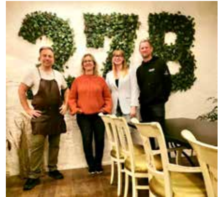
Fællesspisning på 27b

Tak til 27B for at arrangere fællesspisning til fordel for Gademix – og tak til alle som deltog.