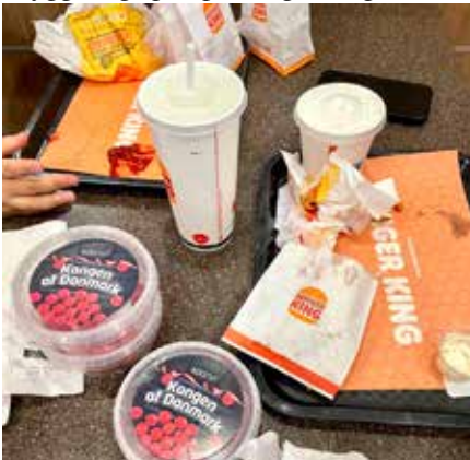
Besøg på BurgerKING da vi fik ny dansk konge

Lige som det meste af Danmark fejrede vi også dagen i Gademix. Børn, unge og frivillige mødtes ved Gademix og gik sammen på BurgerKING. Der blev leget Kongens Efterfølger, spist Kongen af Danmark-bolsjer og ikke mindst hygget og spist på BurgerKing.