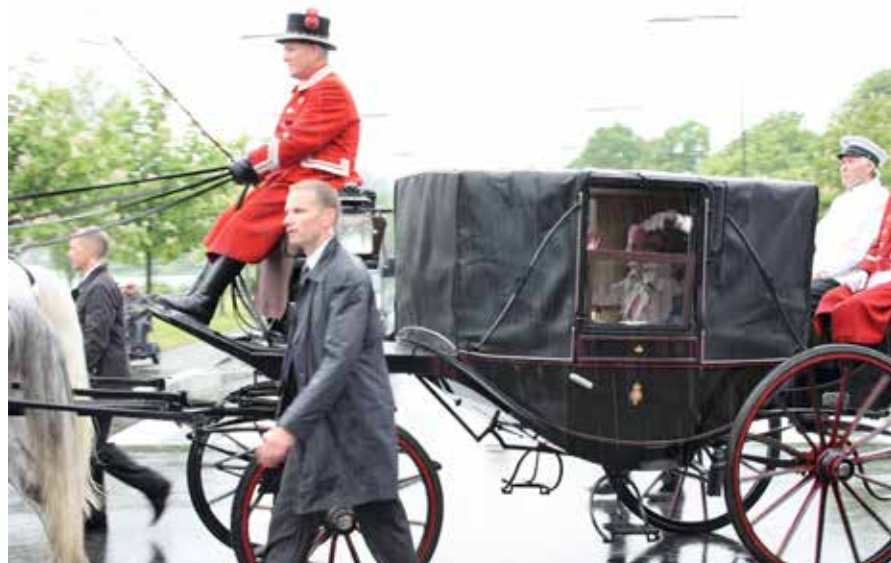
Der var ikke ret meget at se af dronning, da hun i karet kørte forbi i Fredericigade.