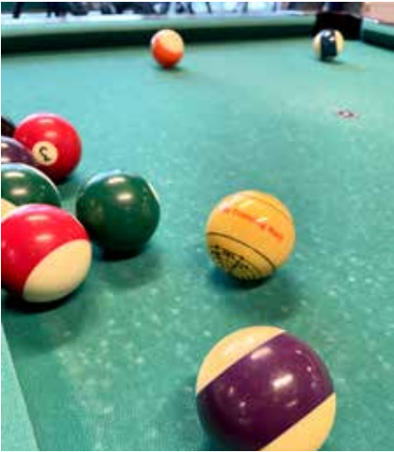
Besøg af Ulrik, som lærte fra sig ved pool-bordet

Nu kan børn og unge fra Sydvest-kvarteret lave deres egne lækre madpakker i Gademix. Med støtte fra Trygfonden kan 10-16 årige HVER ONSDAG AFTEN smøre sig en madpakke og tage den med i skolen dagen efter. Tak til Cafe Netværket for et godt initiativ, så flere børn og unge kan få en god madpakke med i skole.